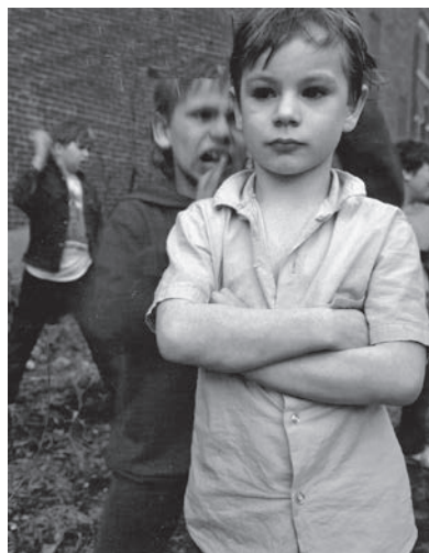
Figura 2. Retrato del fotógrafo Paul D'Amato de lo que, sin duda, es un joven orquídea. Aparece en primer plano, en actitud reservada y distante, mientras a sus espaldas un grupo de agresivos chavales parecen estar a punto de iniciar una pelea. La foto fue tomada en un descampado en Portland, Maine.

Un segundo caso de lo que es ser un niño orquídea se encuentra en la descripción de dos chicos que aparecen en obras maestras: una inolvidable fotografía y un libro intemporal. Significativamente, ambos «retratos» también empiezan a apuntar a otra dimensión de los niños orquídea: sus fortalezas ocultas y sus extraordinarias sensibilidades. El primero de estos retratos, una instantánea tomada por el fotógrafo Paul D'Amato una tarde de 1988, apareció en la portada de la